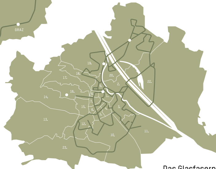
Das Glasfasernetz in Wien